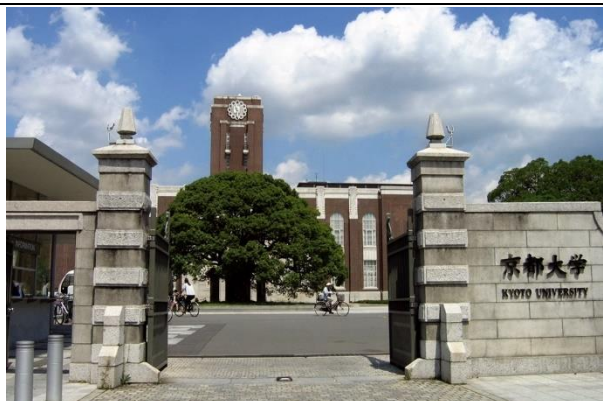
京都大學 2009